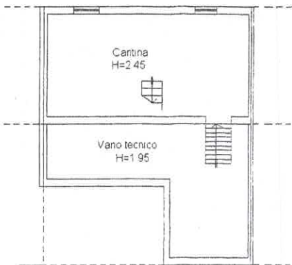
PIANO PRIMO SOTTOSTRADA